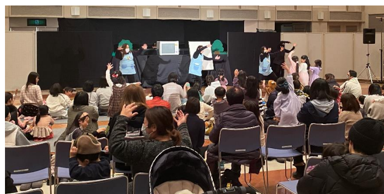
写真上段左 ブックスタートプレゼントパック 写真上段中央 びっくり箱赤ちゃん絵本の読み聞かせ 写真上段右 読書記録手帳配布事業(小学1年生対象) 写真下段 びっくり箱冬のお楽しみ会