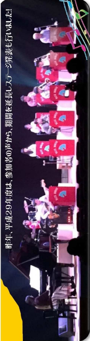
昨年、平成29年度は、参加者の声から、期間を延長し入場券発売も行いました!