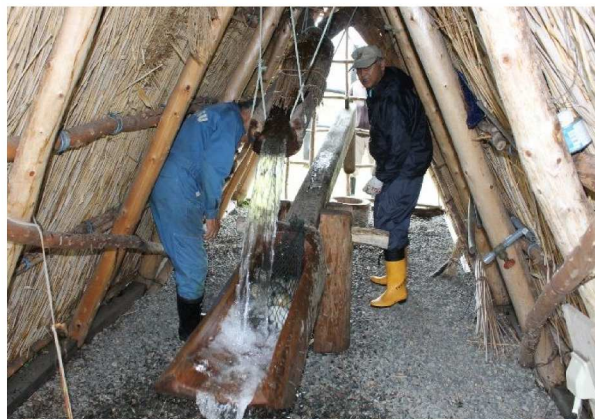
「万里のチャシ」と「バツタリ」を整備する郷土文化研究会のみなさん