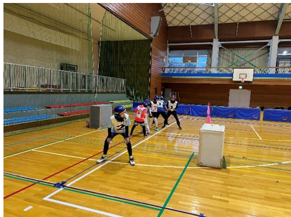
雪合戦教室の様子です

👤 11月19、20日にスポーツセンターで雪合戦教室を行いました！19日は低学年（1年生～3年生）、20日は高学年（4年生～6年生）に分かれて開催し、低学年は作戦会議をしてるチームもあり、高学年は実際の試合と同じルールで行いました。2日間白熱した雪合戦教室になりました。 👤 1月24日（土）には、新冠町子ども会育成連絡協議会主催、チャレンジ雪合戦が開催されます。小学生全学年が対象になりますので、たくさんの参加をお待ちしております！