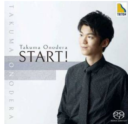
メジャーデビュー CD「始動！」

プロフィール 2005 年生まれ。幼少期から多くのコンクールにて入賞。2014 年から現在までに、ロシア、イタリア、アメリカ等海外でのコンサートに多数出演。2016 年イタリアのコンサートにてコンチェルトを演奏。【第 5 回 Imola Piano Awards(伊)】カテゴリー C 第 1 位。2017 年 【第 2 回クライネフモスクワ国際ピアノコンペティション (露)】ファイナリスト及び特別賞【全日本学生音楽コンクール】第 71 回小学校の部 第 1 位。2018 年 イタリアにてファーストリサイタルを開催。2019 年 名古屋ヤマハホール、ヤマハホール (東京) にてソロリサイタル、カーネギーホール (米) にてコンサート出演。2020 年 【ハーモニウムオンライン+国際音楽コンペティション(アルメニア)】第 1 位。【ウィンザー国際ピアノコンペティション (英)】B カテゴリー第 1 位。【コネロ国際音楽コンペティション (伊)】ヤングアーティスト部門第 1 位。2021 年 【第 8 回 サンドナディ ピアープ国際ピアノコンクール(伊)】年齢制限なし部門 グランプリ 【第 6 回 マルベリャ国際ピアノコンクール (伊)】カテゴリー C 第 1 位 【グレート・マスターズピアノコンクール (西)】32 才以下部門 第 1 位。【グスタフ・マーラーピアノコンクール (チェコ)】グスタフマーラー大賞、第 1 位。【サンノゼ国際ピアノコンクール シニア部門 (米)】第 1 位。【第 10 回オーゾモ国際ピアノコンペティション (伊)】年齢制限なし部門第 1 位。【スケルツォ国際ピアノコンペティション (イスラエル)】ソロカテゴリー グランプリ。【オルベッテロピアノコンペティション (伊)】C カテゴリー第 1 位。他、多数受賞。2022 年 CD 発売記念コンサートツアーを全国 13 ヶ所で開催。仙台国際音楽コンクールピアノ部門セミファイナリスト。2021 年 KNS クラシカルよりファーストソロ CD アルバム "APPASSIONATO" をリリース。2022 年オクタビアレコードよりソロ CD アルバム "始動!" をリリース。市立札幌開成中等教育学校 5 年。公式ホームページ https://takumaonodera.com