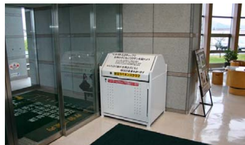
▲役場庁舎に設置している回収箱

いらなくなった眼鏡は役場庁舎とレ・コード館に設置している飲料水ペットボトルキャップ回収箱の中に入れて下さい。