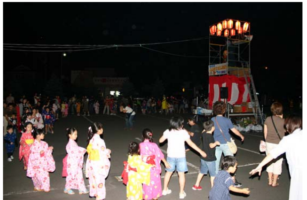
8月 会場は、お盆をふるさと新冠で過ごす人たちで賑わいました。