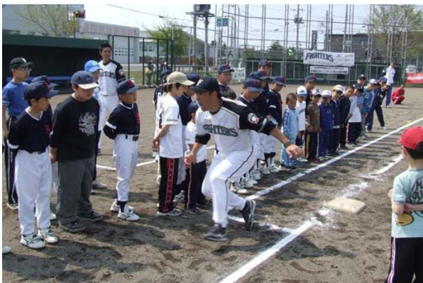
5月 子供たちは、元プロ野球選手だったコーチの話を教えを真剣に聞いていました。