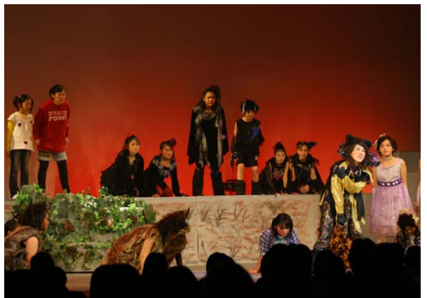
12月 エコロジーと命をテーマにしたストーリーと出演者の迫真の演技で観客を魅了しました。