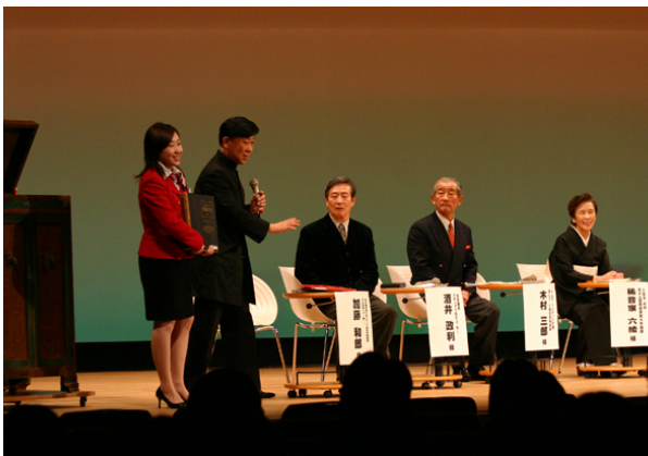
3月 このシンポジウムでは改めてレ・コード館の素晴らしさを再認識しました。