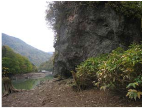
▲岩陰が位置する岩塊

出土しました。特に動物の骨は、シカと思われる歯や様々な部位の骨、人間によって焼かれたため粉々になった碎片、骨角器という人間によって骨を使った道具らしきものまでありました。これらの調査結果が証拠となり、大昔の人間たちが生活の場として使われていた遺跡として北海道の埋蔵文化財に登録することとなりました。平取町にも洞穴遺跡はありますが今は現存しておらず、日高管内で現在のところ残っている岩陰・洞穴遺跡はこの岩清水の遺跡のみとなっております。