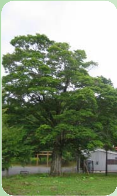
場所：新冠町字太陽（太陽婦人ホーム） 樹木の太さ：約0.9 m