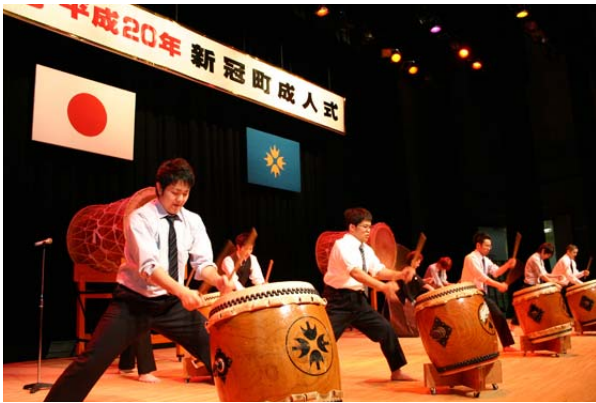
1月 新冠町成人式に56人が出席し、新成人として新たな一歩を踏み出しました。