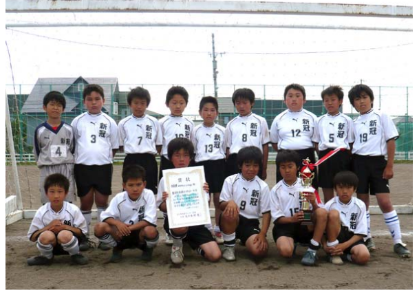
7月 チームワークで少年団設立以来初の快挙となる準優勝を飾りました。