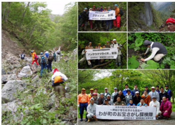
6月 険しい沢を探索しながら、岩清水の資源を調査し、湧水を採取しました。