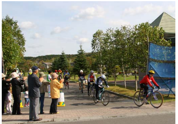
10月 初めて開催された優駿浪漫街道サイクリング。沿道でも多くの方が出場者にエールを送りました。