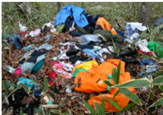
▲平成20年10月28日 緑丘での不法投棄現場 現在、静内警察署で捜査中です。

廃棄物の投棄は、「廃棄物の処理及び清掃に関する法律」により禁止されており、5年以下の懲役、若しくは1千万円以下の罰金又は併科が科せられます。絶対に不法投棄はやめましょう。