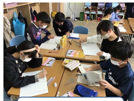
5/12 5・6年生 「レクレーションと共同学習」