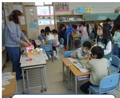
5/15 2年生 「風船で人形制作」