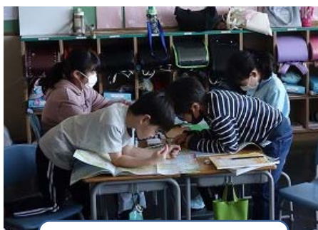
5/11 3・4年生 「通常授業と休み時間」

また、各小学校では、ホームページで学校の様子を紹介しております。児童の学校での活動の様子を見ることが出来ますので、ぜひ一度アクセスしてみてください。