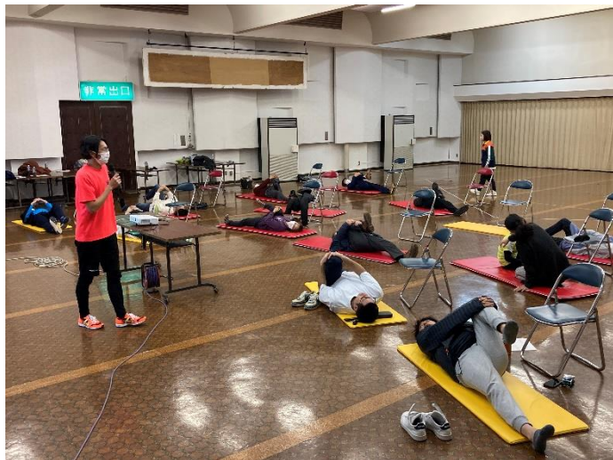
↑怪我予防教室の写真

令和6年2月13日（火）に小学生1～3年生を対象に開催され、22名の参加がありました。教室ではサッカーの基本の動き（ドリブル・パス・シュート）等を体験し、最後に試合を行いました。未経験者が多かった為、最初はボールを蹴る事も難しかったですが、最後の試合ではチームで声を掛け合い協力しながら試合を進めていき、楽しくサッカーをする事ができました。