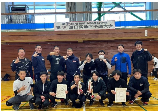
↑「一般の部」優勝、準優勝の2チーム

※『No Image』『NAT』については3月3日(日)に壮瞥町にて開催される昭和新山国際雪合戦大会に出場します。