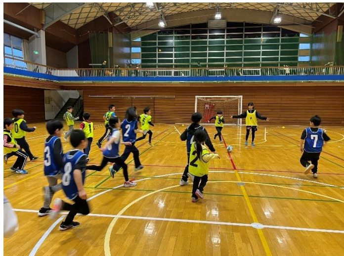
↑サッカー教室の写真