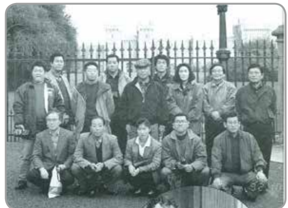
参加者集合写真(イギリス・ウインザー城前にて)

現在、新冠町では、認定こども園と小中学校の全校で、この自校調理方式を取り入れております。また、日高管内の状況としては、センター方式を採用している町があるほか、学校での給食の提供をしていない町もあるなど、各町によって対応は様々なようです。 ほかに、この広報誌の特集の中では、保護者や栄養士、先生や調理員のコメント、1週間の給食の献立、各小学校の子どもの給食についてのコメントなども掲載されています。 さらに、広報誌を読み進めると、平成4年10月に行われた『第三回町民海外派遣研修報告』が掲載されています。 『町民海外派遣事業』は、広く海外に目を向け、特色ある地域づくりや心豊かな人づくりを進めるため、また、新冠町の未来を拓く人材育成と後継者の育成を目指し、平成2年から10年までの間、計9回実施されました。訪問した国は、ヨーロッパ諸国、オーストラリア、アメリカなど多地域に渡り、9年間で延べ118名が参加しました。 平成4年度の研修事業は、10月26日から11月6日までの12日間の日程で、イギリス、ドイツ、フランスの西欧3ヶ国の視察を行いました。 広報誌に掲載されている記事は、帰国後に参加者全員で行った意見交換会の様子で、イギリスで訪問した競馬場や競馬と住民の関わりについての話しから始まり、古い文化を保存継承する